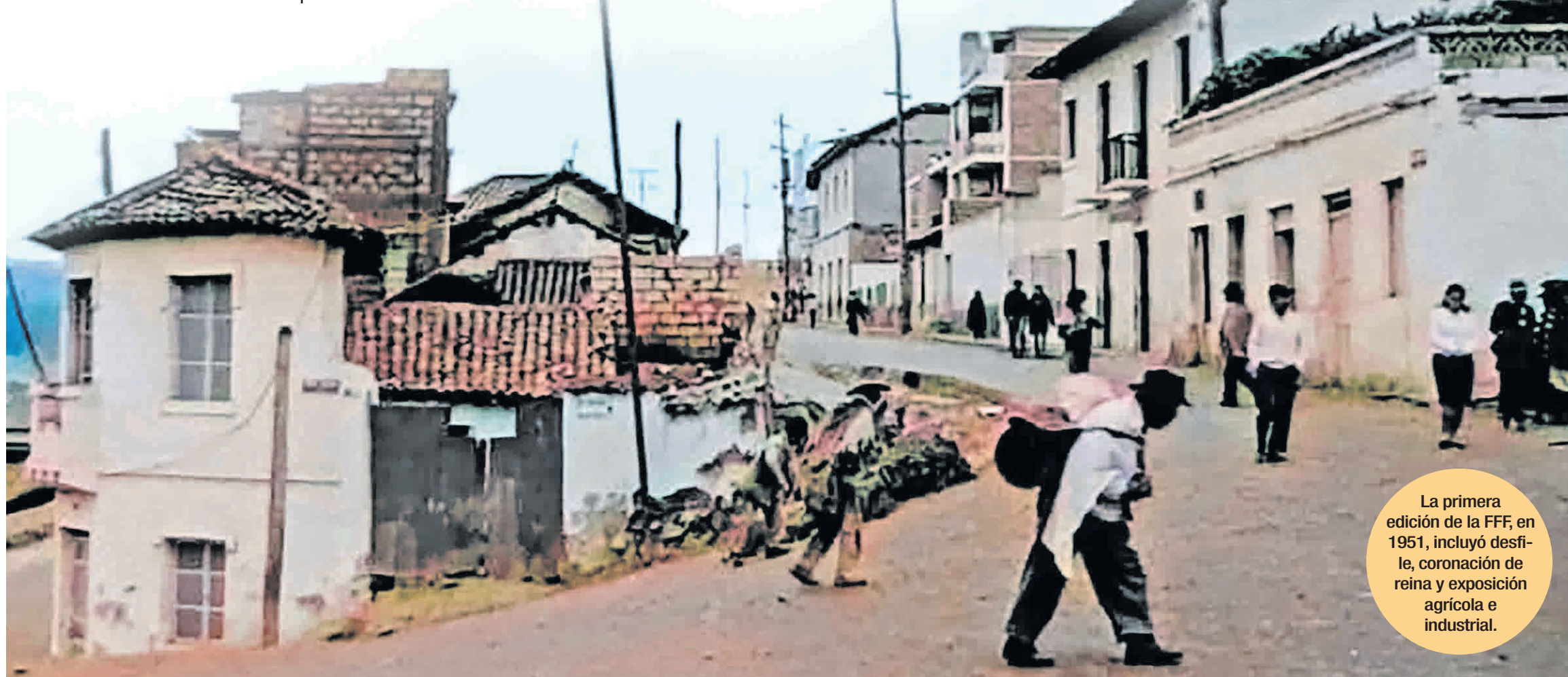
La primera edición de la FFF, en 1951, incluyó desfile, coronación de reina y exposición agrícola e industrial.

100 MIL PERSONAS aproximadamente se quedaron sin hogar en Tungurahua.