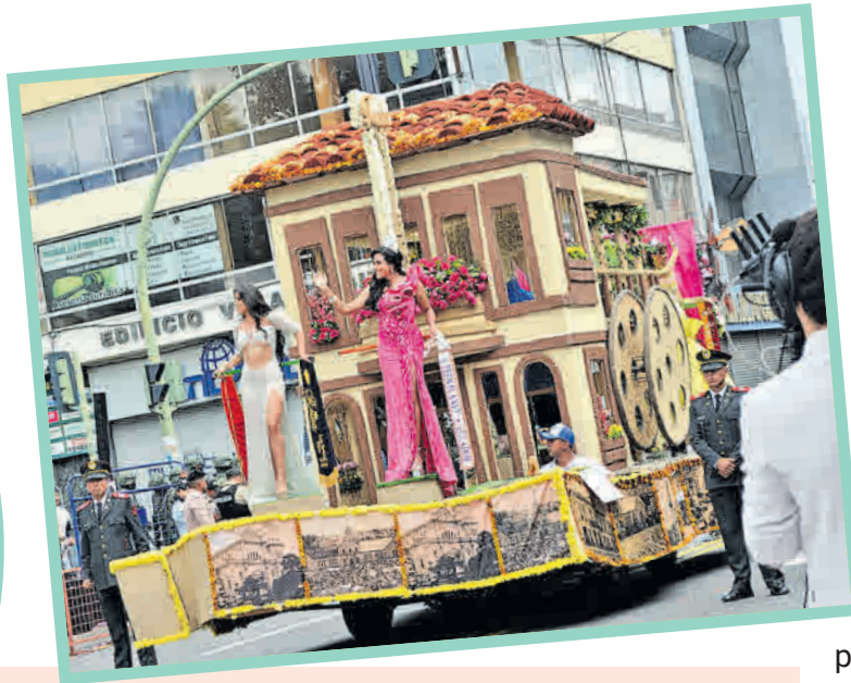
La construcción se inicia con la convocatoria del Comité de la FFF. De los postulantes se eligen los mejores diseños y creadores, quienes deben acreditar experiencia. Desde diciembre, el trabajo es constante hasta los días de la fiesta.