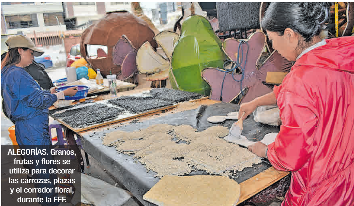
ALEGORÍAS. Granos, frutas y flores se utiliza para decorar las carrozas, plazas y el corredor floral, durante la FFF.

La venta de frutas y flores propició la reactivación económica y, con ella, la fiesta masiva, un homenaje vivo al trabajo del campo tungurahense.