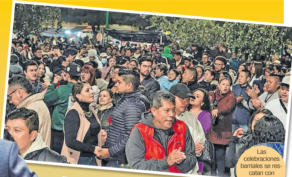
Las celebraciones barriales se rescatan con serenatas y mingas.