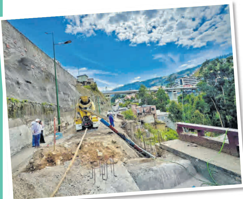
PLAN. Ambato tendrá 101 nuevas vías que facilitarán el transporte de productos y mejorarán la movilidad.

Además de las obras, se organizarán talleres de capacitación y ferias en todo el año para incentivar a los emprendedores e impulsar la economía de la urbe.