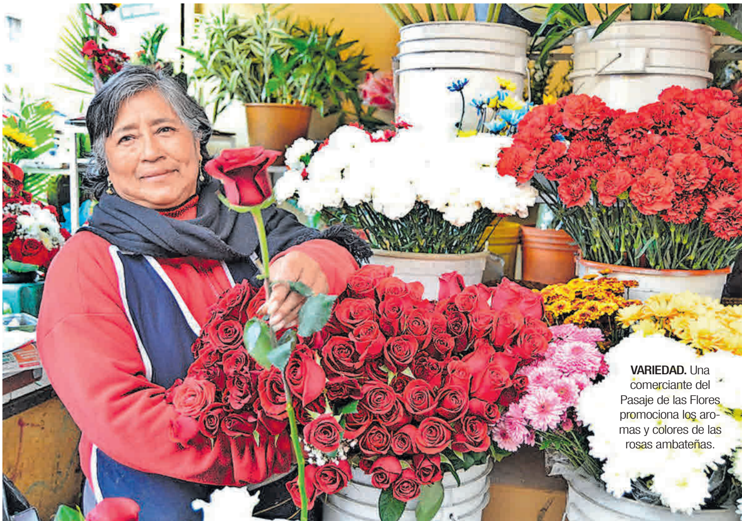
VARIEDAD. Una comerciante del Pasaje de las Flores promociona los aromas y colores de las rosas ambateñas.