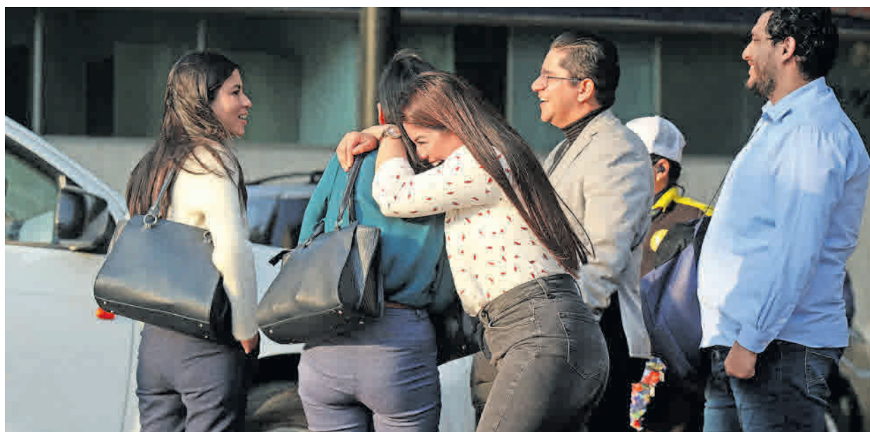
Camaradería. En el centro de Guayaquil, la cámara capta a un grupo de amigos conversando amablemente y riéndose.

“Los guayaquileños tenemos una personalidad como la de MacGyver: solucionamos todo con ingenio. Históricamente, siempre tuvimos los bríos para levantarnos de los grandes incendios y de los ataques de los piratas. Tenemos resiliencia.”