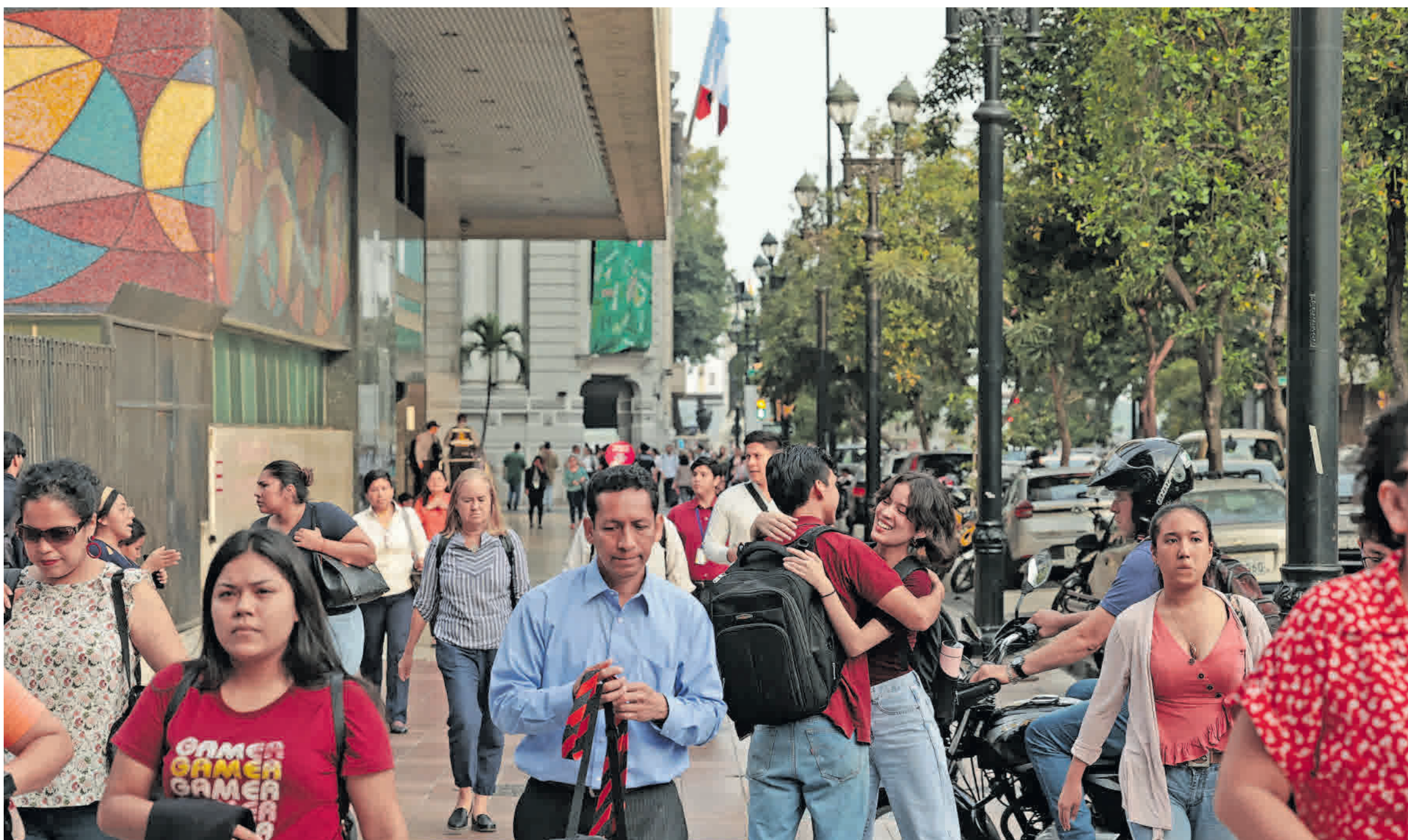
Corazón porteño. Una escena cotidiana en el bulevar 9 de Octubre. Personas caminando con prisa se dirigen a sus trabajos y diversos destinos. Entre la multitud, destaca una pareja de amigos abrazándose con entusiasmo.