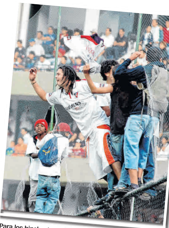
Para los hinchas, la Noche Blanca es el momento para festejar un nuevo año del equipo junto a los jugadores.

6 COPAS INTERNACIONALES tiene LDU; una Copa Libertadores, dos Copas Sudamericanas y dos Recopas