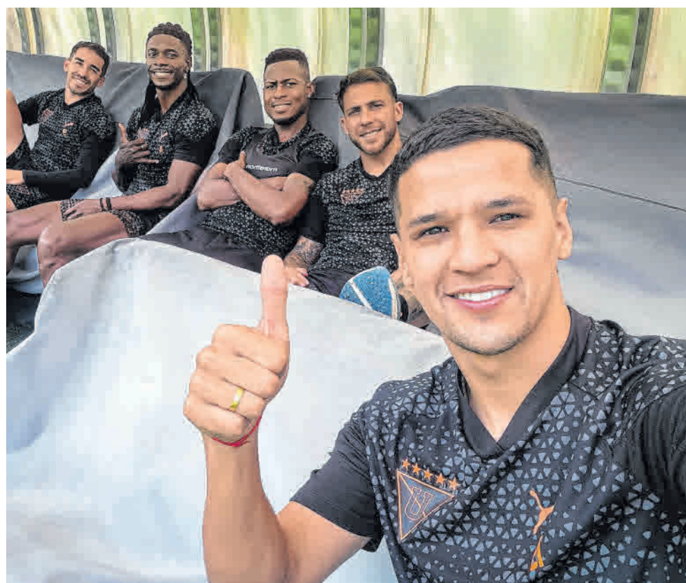
La unidad de la plantilla es una de las fortalezas de los albos.

La Copa Ecuador es la otra competencia en la que Liga de Quito participará este año y en la que buscará sumar una nueva conquista.