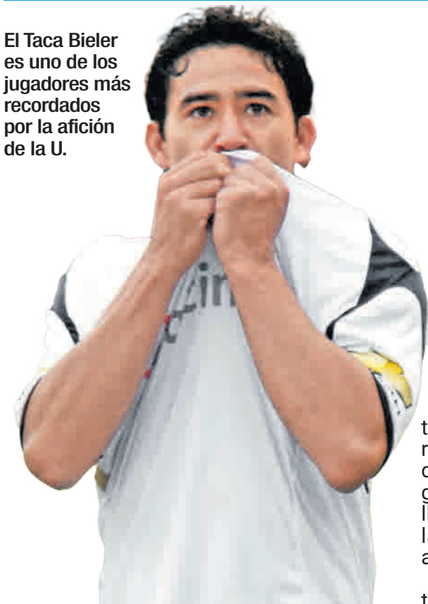
El Taca Bieler es uno de los jugadores más recordados por la afición de la U.

2. Paolo Guerrero y Hernán Barcos regresan a la Casa Blanca con Alianza Lima.