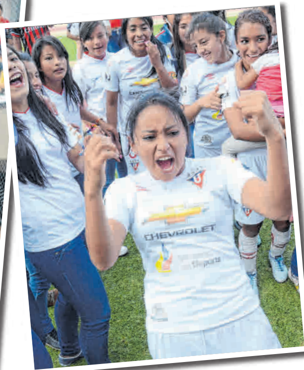
La hinchada celebra los triunfos de LDU incluyendo el reciente bicampeonato, obtenido en diciembre.