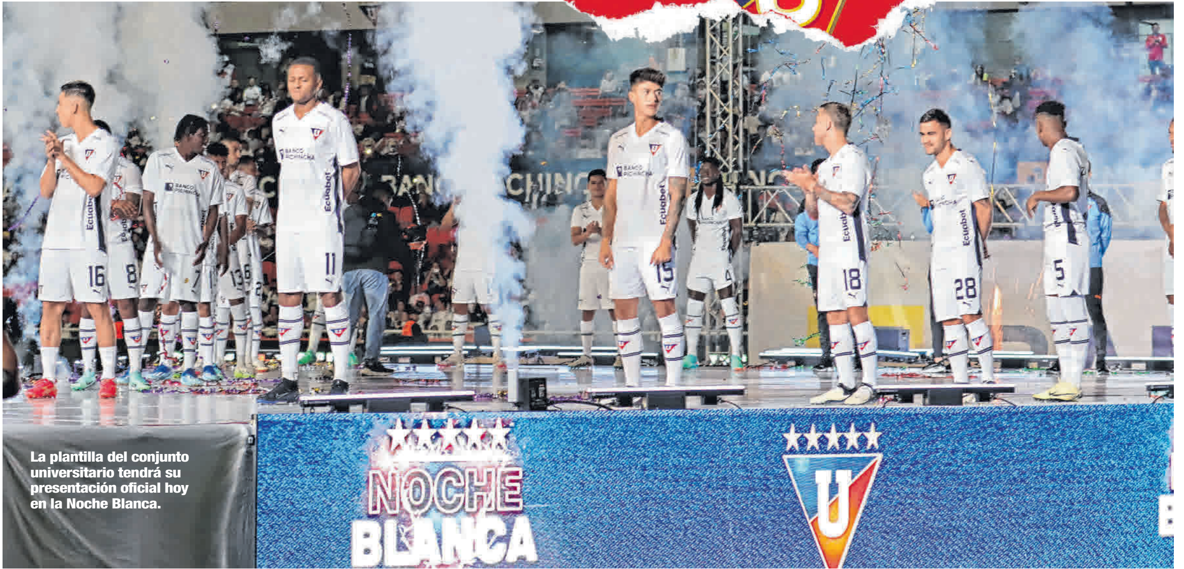
La plantilla del conjunto universitario tendrá su presentación oficial hoy en la Noche Blanca.