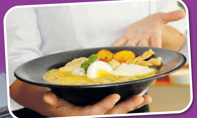
La Semana Mayor es una fecha donde se ofrece la gastronomía típica. El valle premiará el mejor plato de fanesca.