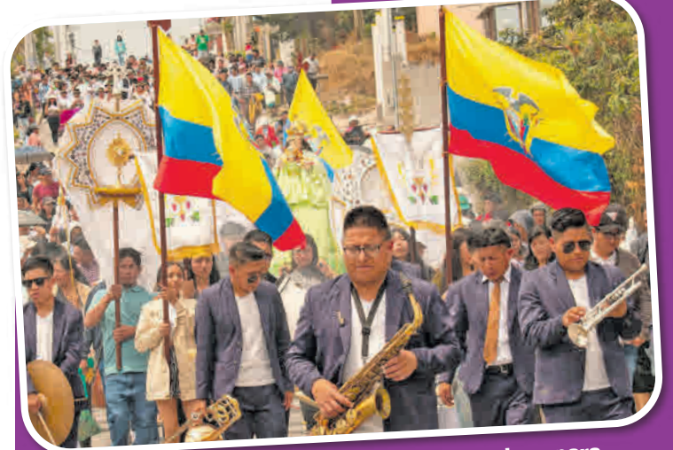
Los devotos y sacerdotes se organizan para participar en las procesiones religiosas.

Aunque la Semana Santa se caracteriza por ser una celebración religiosa, también es la ocasión ideal para que los turistas aprovechen el feriado y visiten otros espacios emblemáticos del valle, como El Chaquiñán, el balneario de Cununyacu, las rutas ecológicas en el volcán Ilaló, así como los restaurantes.