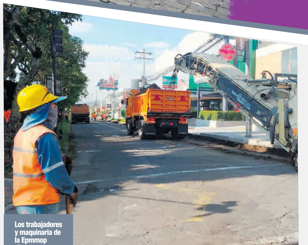
Los trabajadores y maquinaria de la Epmop ejecutan las obras viales.

nes por los eventos climáticos, la Alcaldía declaró el estado de emergencia en las parroquias de Cumbayá, así como en la Mariscal Sucre e Itchimbía.